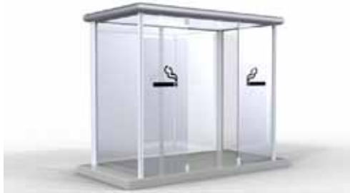
Reichweite des LKW-Kran 11m