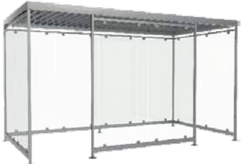
Reichweite des LKW-Kran 12m