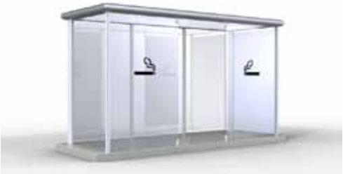
Reichweite des LKW-Kran 9m